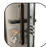
Замок Зенит 2 класса взломостойкости