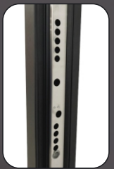
Ответная планка из нержавеющей стали