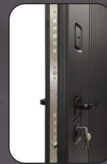
Замковая система Эльбор 4 класса