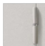
ПЕТЛИ С ПОДШИПНИКОМ