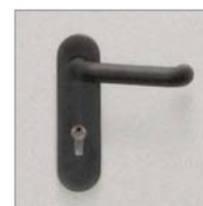
Замок ПРОСАМ 3В4-31/55