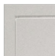
КОРОБ С НАЛИЧНИКОМ