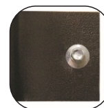
Крепление на монтажные уши