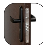
Замок ПРОСАМ 2 класса взломостойкости